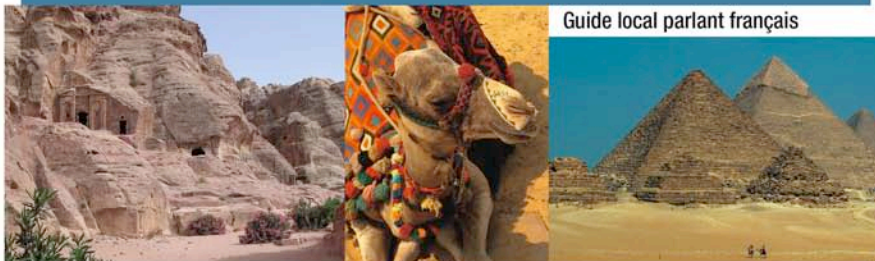
Guide local parlant français

ÉGYPTE, MAROC, MALI, JORDANIE, SYRIE, OMAN